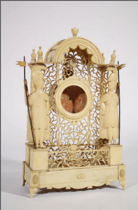
Marine - Objets de grande collection dont travaux de ponton des guerres napoléoniennes

Rare porte montre en os, travail de ponton, début XIX e