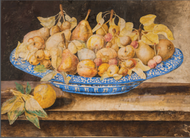
ECOLE ITALIENNE vers 1600 Gouache 35 x 49 cm