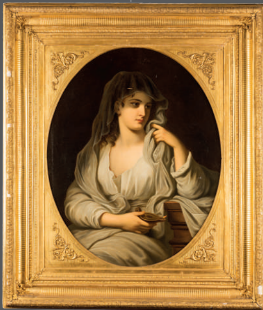
ECOLE FRANCAISE du XIX e siècle Portrait d'une vestale, d'après Angelica KAUFFMAN Huile sur toile 95 x 76.5 cm