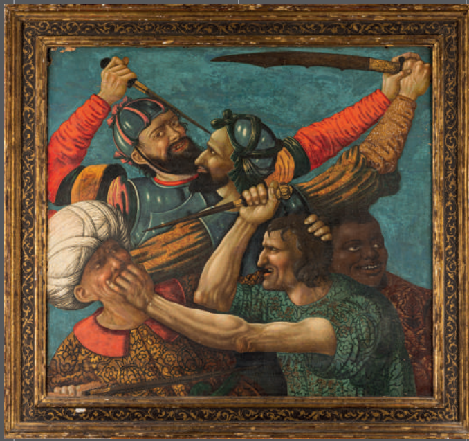
ECOLE LOMBARDE du XVI e siècle Souvenir de Léonard de Vinci Combat contre les Ottomans Tempéra, huile sur panneau parqueté 64 x 70,5 cm