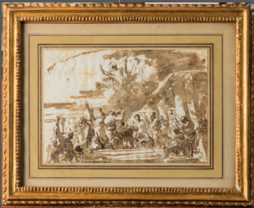
Domenico TIEPOLO (1727-1804) Scène religieuse Plume et lavis d'encre brune, signé en bas à droite 19,2 x 27,5 cm