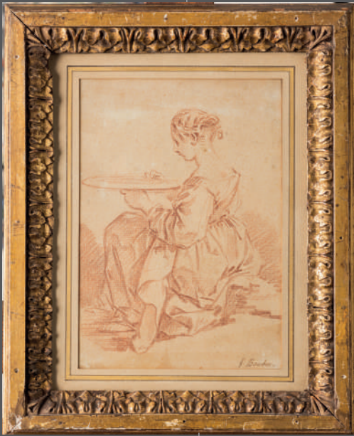
Attribué à François BOUCHER (1703-1770) Sanguine 22.3 x 15.7 cm