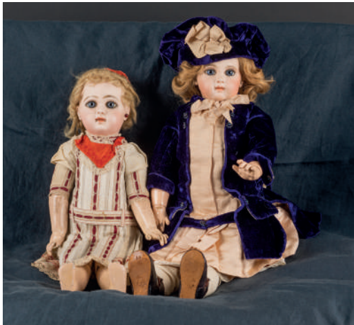
Poupées dont JUMEAU, l'une marquée EJ en creux, l'autre taille 8 au tampon rouge sur la tête et tampon bleu sur le corps