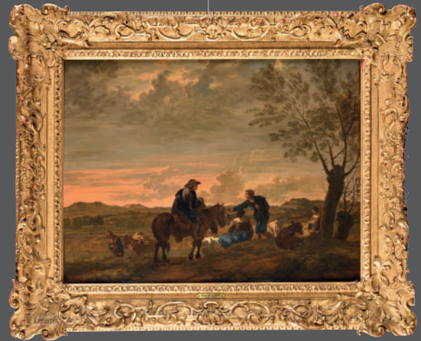
Attribué à Karel DUJARDIN (Amsterdam 1626-Venise, 1678) Huile sur toile 56 x 75 cm