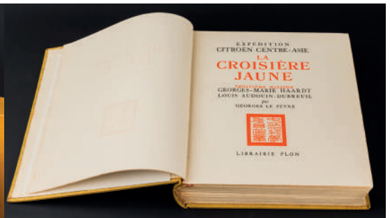
Livres dont volume de souscription du livre d'or du yachting contenant 8 planches couleurs de Marin- Marie, livre d'heures d'Anne de Bretagne chez Curmer 1841 complet de ses chromolithographies couleurs, les deux grandes croisières Citroën, La noire avec un envoi de Mr Haardt et la Jaune avec un envoi d'André Citroën et accompagnée du film en 16 mm.