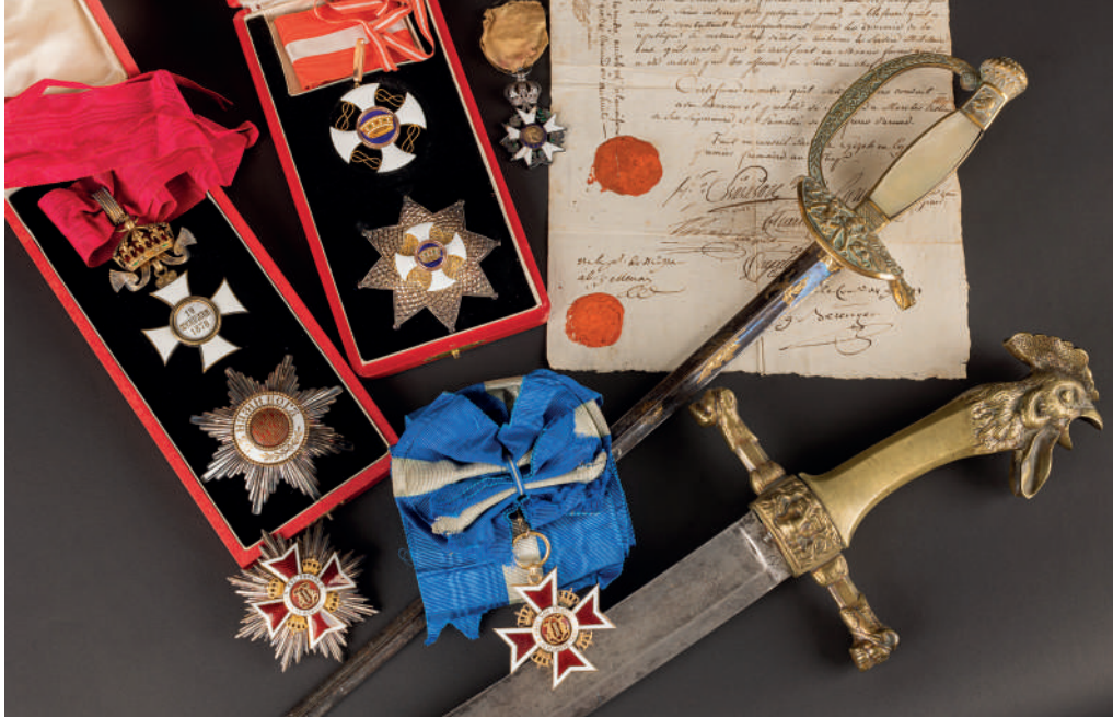
Souvenirs historiques - Armes anciennes Suite d'armes à feu, d'armes blanches et d'équipements. Bel ensemble d'ordres de chevalerie et de décorations, dont Légions d'honneur du 1 er Empire à nos jours, ensembles de l'ordre de la Couronne de Roumanie et de Saint Alexandre de Bulgarie.