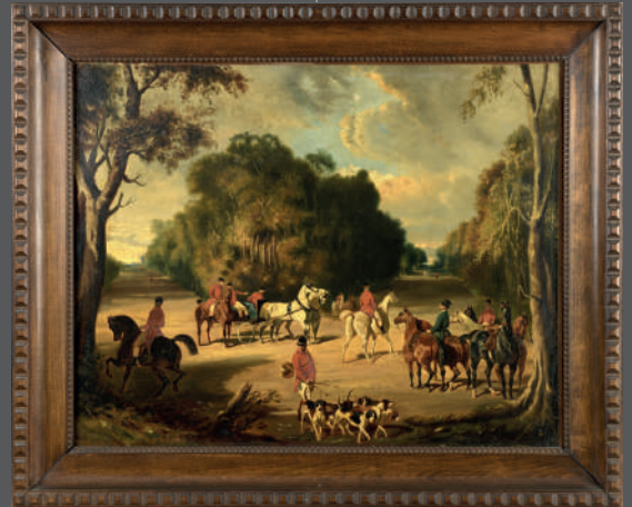
ÉCOLE FRANÇAISE de la fin du XIX e siècle Huile sur toile 52 x 65 cm