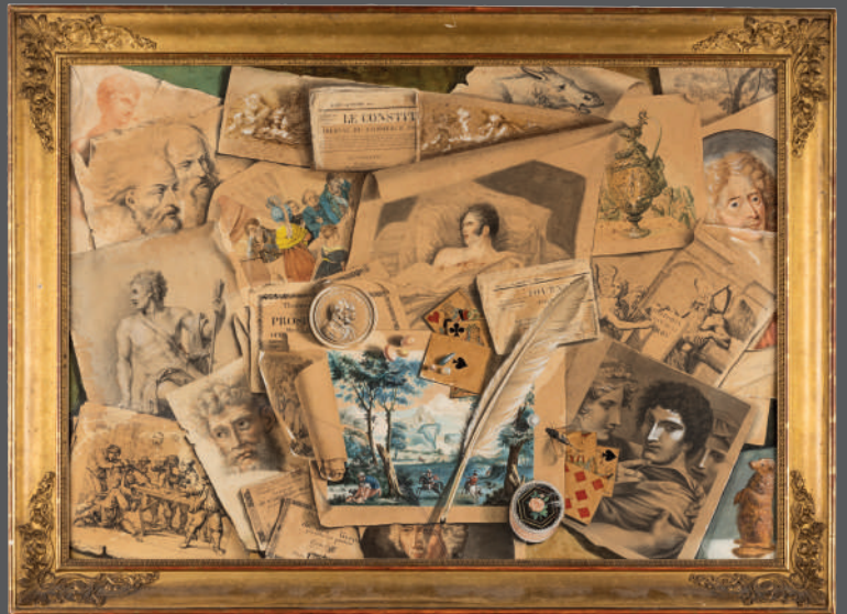
Attribué à Jean-Pierre NORBLIN DE LA GOURDAINE (1745-1830) Trompe-l'oeil illustrant la vie et la mort de Charles-Ferdinand d'Artois, duc de Berry (1778-1820) Pierre noire, aquarelle, plume et gouache sur papier 56 x 78 cm