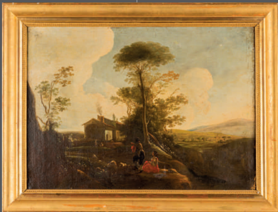
ÉCOLE FRANÇAISE vers 1840 Huile sur toile 50 x 68 cm