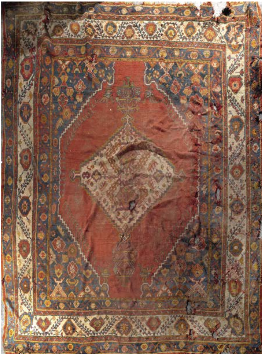
313 • Grand tapis Ushak (usures et accidents) 800/1.000 €