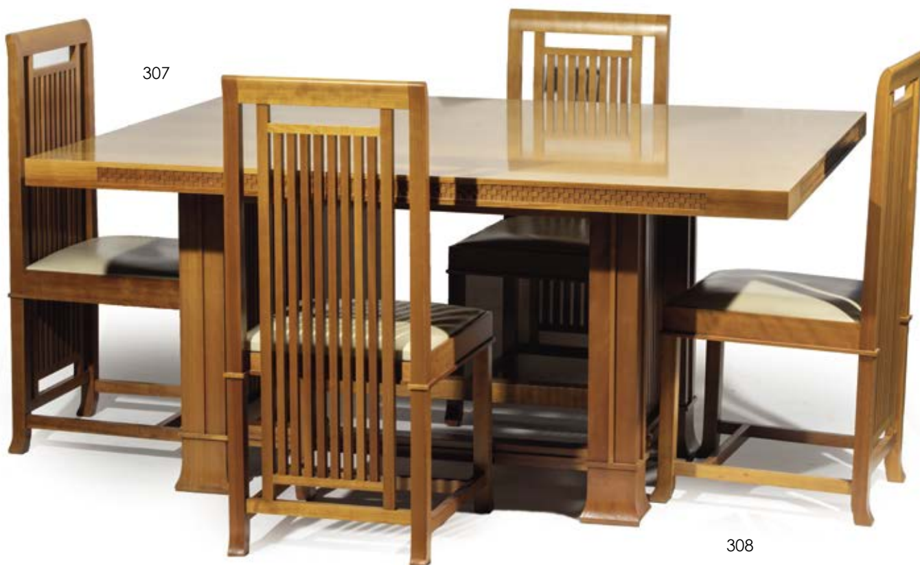
307 • Frank Lloyd WRIGHT (1869-1959) & CASSINA. Table de salle à manger en cerisier verni modèle « Husser » à plateau rectangulaire. Edition Cassina (Marques d'usage) 1.000/1.500 €