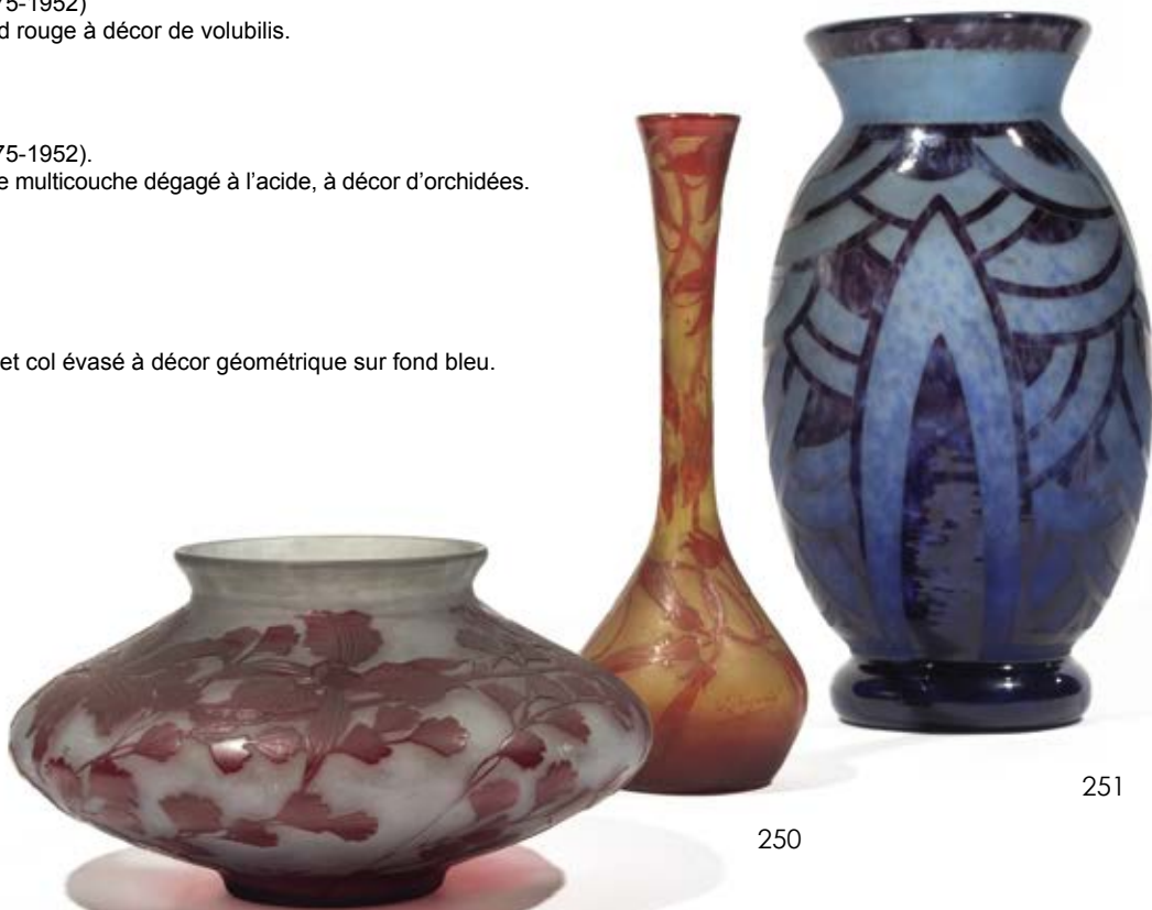
251 • LE VERRE FRANCAIS Vase ovoïde à corps légèrement aplati et col évasé à décor géométrique sur fond bleu. Signé Hauteur : 31 cm 300/400 €