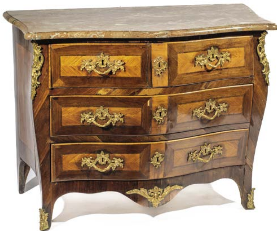
256 • Commode marquetée ouvrant par quatre tiroirs sur trois rangs. Dessus de marbre. Ornementation de bronzes dorés, chutes, entrées de serrures et sabots. Louis XV (manques et accidents) 84 x 106 x 48 cm 400/500 €