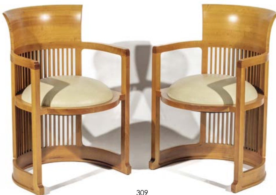
309 • Frank Lloyd WRIGHT (1869-1959) & CASSINA. 606 ou Barrel chair (1937) Deux fauteuils en bois (cerisier) assise circulaire à barreaux. Cassina Editeur 81 x 55 x 55 cm 800/1.000 €