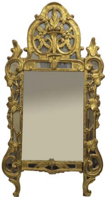
247 • Miroir en bois sculpté doré à parecloses , le fronton sculpté d'un panier de grenades, les montants à décor de pampres de vigne, décor de coquilles. XVIIIème siècle 115 x 58 cm 600/800 €