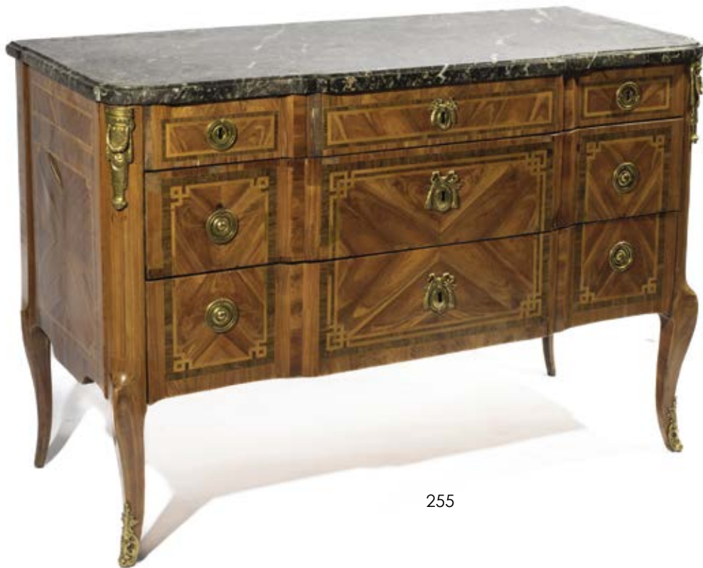
255 • Commode en bois de placage à ressaut central. Dessus de marbre. Bronze doré aux chutes et entrées de serrures. Décor marqueté en aile de papillons dans des filets 'encadrements à la grecque. 90 x 126 x 60 cm 200/400 €