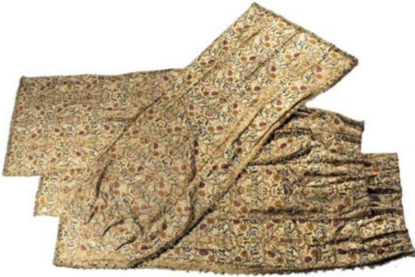
310 • Trois rideaux brodés de fleurettes 200/400 €